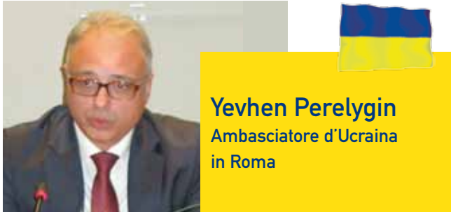
Yevhen Perehyin Ambasciatore d'Ucraina in Roma