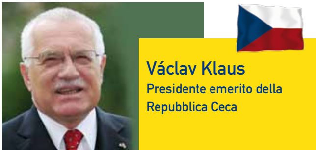
Václav Klaus Presidente emerito della Repubblica Ceca

Then, there was one initiative which was remarkable and turned out in a very different way as it was planned a year ago: Belarus wanted to come in a bit more with the CEI and invited for a conference dealing with eastern partners like Ukraine, Moldova and Belarus, in our case members of the CEI to discuss. Meanwhile the situation has developed and the conference has become an important and relevant event. We have a prime ministers meeting in Vienna in November and the year will end with a meeting in Ukraine dealing with the crisis and how to facilitate relations with the eastern partners. Let me finish with reminding Mr. Busek, who used to lead the Stability Pact for south-eastern Europe and who said: "Well we had this idea 25 years ago with the Central European Initiative, we thought we would develop and make things better and we made some steps forward, but I have a feeling that we are stepping back again. What did we do wrong?" And I think that this could be the question for today's event.