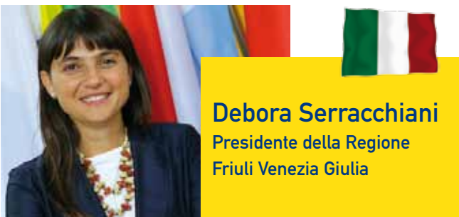
Debora Serracchiani Presidente della Regione Friuli Venezia Giulia

Purtroppo un arcaico centralismo di questa nostra repubblica non consente alle istituzioni di fare politica estera. Noi con ciò vorremmo solo dimostrare che, come privati, abbiamo cercato e forse siamo stati capaci di farla nell'interesse di questa Regione e di questo nostro Paese. Questo è un patrimonio, che mettiamo nelle mani di ogni persona che ha responsabilità istituzionali, economiche e sociali.