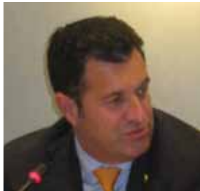
Franco Iacop Presidente del Consiglio regionale - Regione Friuli Venezia Giulia

hundreds of lives and continues to pay more. My friends used to play football on the streets, now they are at war, protecting the borders between Russia and Ukraine. So, the last question is how to get out of this crisis? I see only one possible solution: Europe must return to their baseline values peace, security, freedom and solidarity. Europe united with Ukraine.