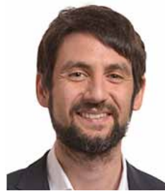
Marco Zullo Deputato al Parlamento Europeo - Repubblica Italiana

finanziaria della dimensione europea per riprendere un respiro più legato agli obiettivi di una vera entità e identità. Un'entità interna e anche una esterna che sia la capacità di essere un soggetto politicamente presente con una identità e capacità propria di essere un elemento che non vada a prevaricare altre entità, ma a portare contributo di storia, di esperienza, di civiltà e di capacità anche di intervenire e di essere protagonista nelle grandi scelte. Si è parlato stamattina di rapporti con Ucraina, Europa e dopo si parlerà di Russia. Quindi, è proprio in questo senso che mi auguro vada in qualche modo rilanciata un'identità europea. "L'Europa senza Europa, Europa in crisi o crisi in Europa" è un tema sul quale ovviamente dobbiamo intergarci e su cui, soprattutto, dobbiamo rilanciare il dibattito.