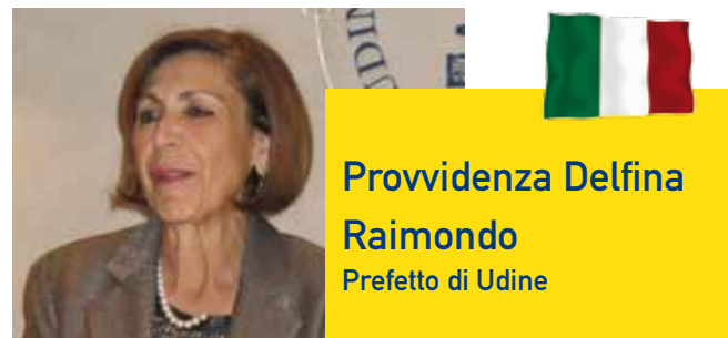
Provvidenza Delfina Raimondo Prefetto di Udine

Non vorrei che questo fosse solo un saluto formale, vorrei esprimere due pensieri che sono legati a questo incontro e cioè la necessità che ci si trovi, ci si incontri, per conoscere qual è la nostra realtà e quale sia il nostro passato per guardare avanti. Perché senza la conoscenza della nostra realtà, del percorso che ha fatto, che hanno fatto i nostri popoli e le nostre nazioni non riusciremo a capire dove andremo, in che modo, in che maniera significativa riusciremo a muovere i passi verso il futuro. Verso un futuro che è attraversato da turbamenti e preoccupazioni. Tuttavia, questi incontri sono essenziali perché riusciamo a discutere, nel segno della collaborazione, della cultura, dell'interscambio con una prospettiva di pace, di serenità e di collaborazione fra gli Stati. L'occasione di oggi, il confronto, il dialogo possa essere un elemento fondamentale com'è negli auspici e anche negli scopi statutari dell'Associazione Mitteleuropa, che possa essere elemento di unione e di coesione, abbiamo tanto bisogno di coesione a livello nazionale ma anche internazionale. Grazie!